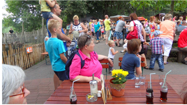
die goochelaar is zo leuk.....