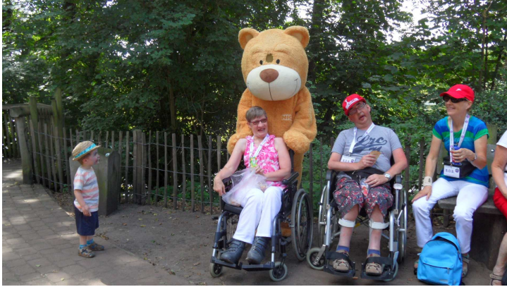
Dat is grappig met zo'n beer achter je...