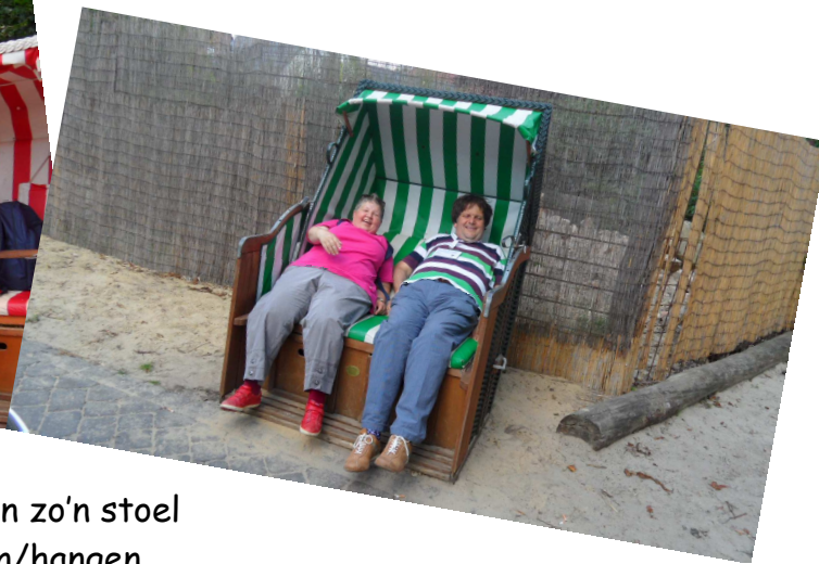
Lekker lui in zo'n stoel te liggen/hangen